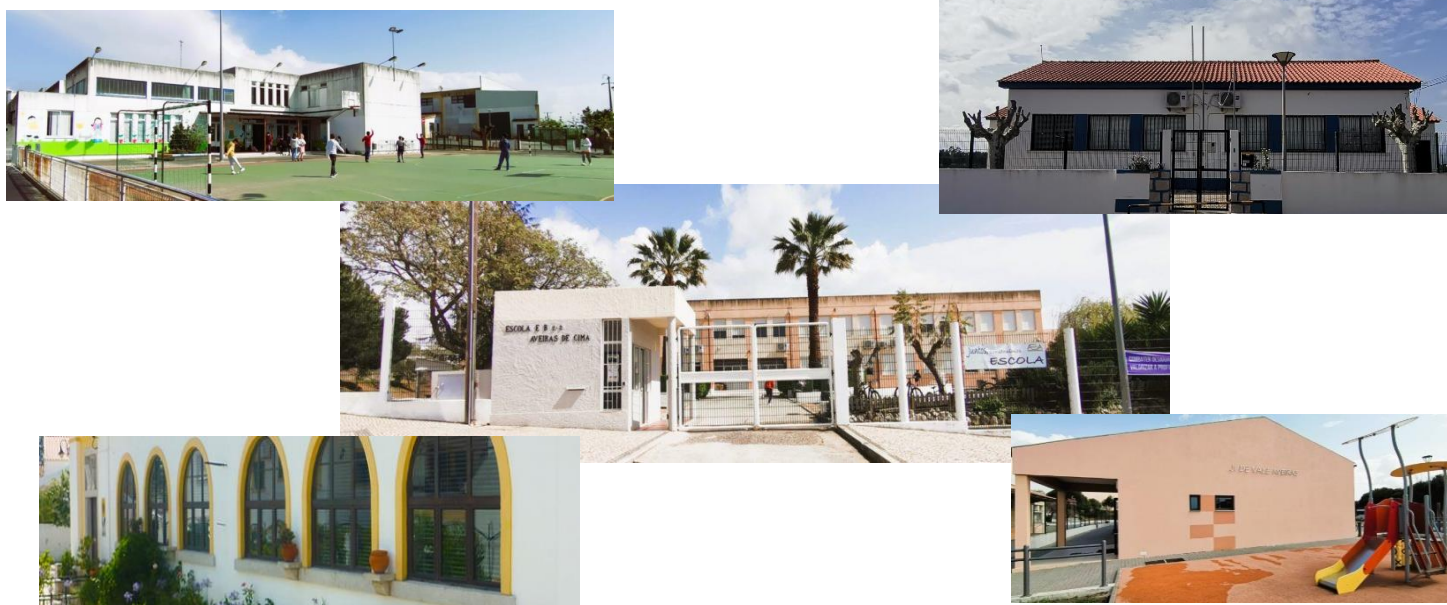
Figura 1- Agrupamento de Escolas Vale Aveiras

As três comunidades, Vale do Paraíso, Vale do Brejo e Aveiras de Cima, tradicionalmente associadas a um meio rural com nível socioeconómico baixo, têm vindo a evoluir por força da modernização da agricultura e pela proximidade de polos logísticos e industriais.